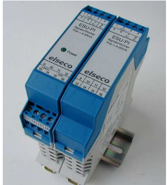
Signalumformer ESU-PI4-SV und ESU-PI4

Der Signalumformer ESU-PI4 ist speziell für die Niveaufassung in Verbindung mit einer SPS konzipiert, kann aber generell für alle Anwendungen bei denen ein Potentiometer eingesetzt ist für die Signalumsetzung verwendet werden.